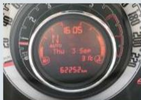
メーター（走行距離）