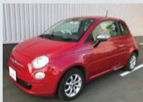
外観（前・後・横・斜め）