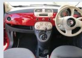
インパネ・ハンドル周り